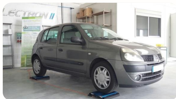
Etape 2: Pesée du véhicule