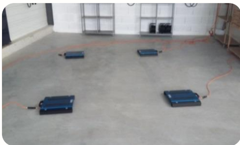
Etape 1: mise à zéro des balances

Ces informations seront utiles et nécessaires lors d'essais de comportement à vide et en charge.