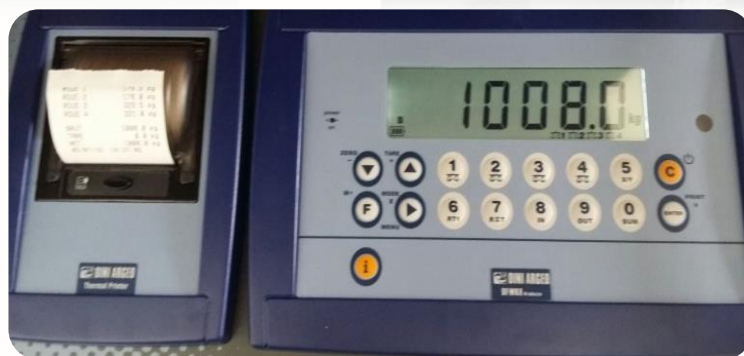
Etape 3: Affichage des valeurs et impression du ticket